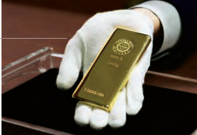
GOLDBARRENKAUF: Die Lagerung des Kleinods sollte bedacht werden

Um die Seriosität der Sparplan anbietenden Edelmetallhändler zu beurteilen, wurden in den Fragenkatalog auch entsprechende Kriterien aufgenommen. Wichtig ist dabei, ob der Edelmetallhändler Mitglied des Berufsverbands des Deutschen Münzenfachhandels e. V. ist, ob schon Jahresabschlüsse im Bundesanzeiger veröffentlicht wurden und wie lange bereits Sparpläne angeboten werden.